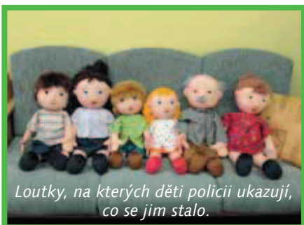
Loutky, na kterých děti policii ukazují, co se jim stalo.