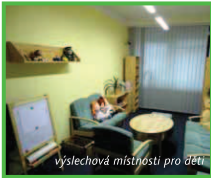
výslechová místnost pro děti

V minulém článku jsme naznačili několik skutečností, ke kterým jsme požádali o podrobnější vyjádření ty nejpovolnější – kriminalisty, kteří se problematikou v praxi zabývají. Jím jsme položili dvě otázky: