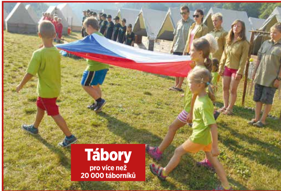
Tábory pro více než 20 000 táborníků