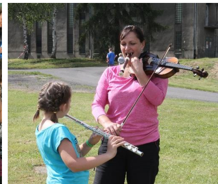
MUZIKANTI PRÁVĚ LADÍ.