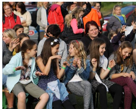
KDO MÁ DOMA PŘÍŠERU?