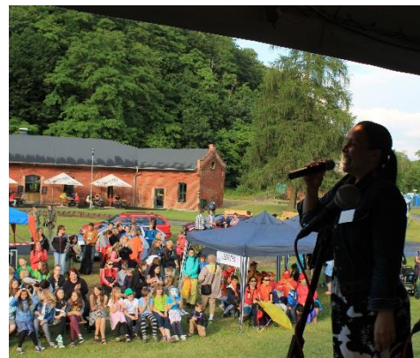
MODERÁTOŘI BYLI ÚŽASNÍ.