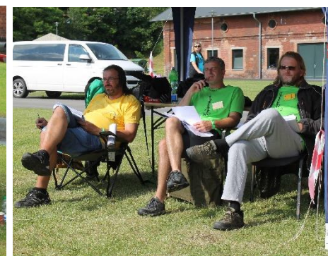
NAJDI DESET ROZDÍLŮ. ;-)