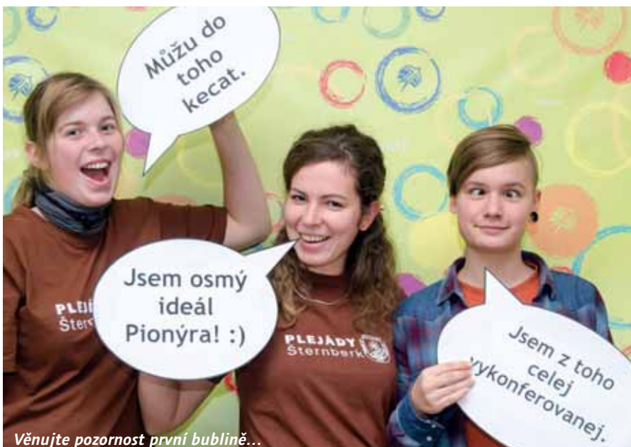
Věnujte pozornost první bublině...

děláme, dokonce to je jeden z charakteristických rysů Pionýra. Jenže v našem základním dokumentu to dříve chybělo.