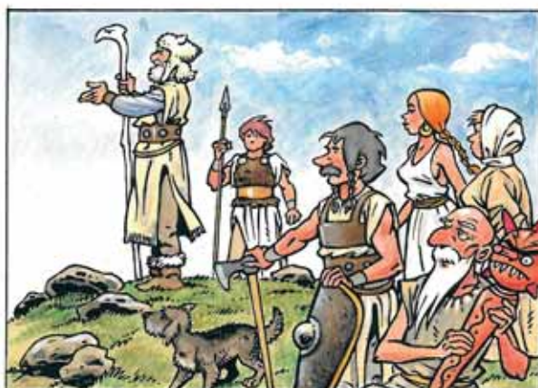
Když vystoupal na horu Říp, zalí - bila se mu okolní krajina.