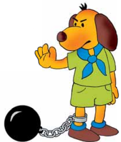
Ilustrace: J. Dostál