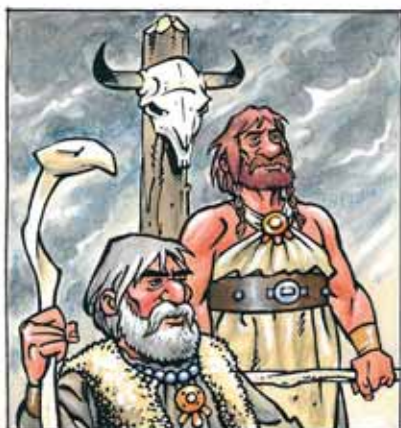
Jeho bratr se jmenoval LECH.