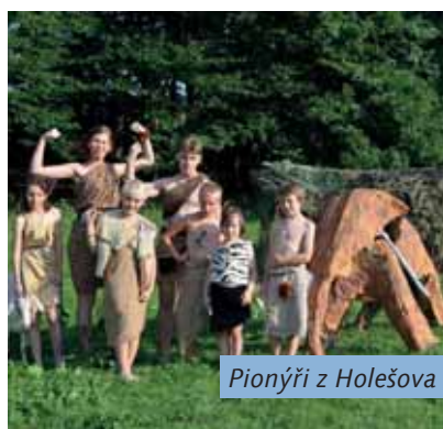
Pionýři z Holešova