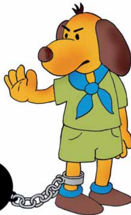
Ilustrace: J. Dostál

Toto povídání je tak jen prvním krokem, úvodem k několika dalším pokračováním. Pokud se chcete do rozpravy na toto téma zapojit a přispět konkrétní zkušeností či názorem,