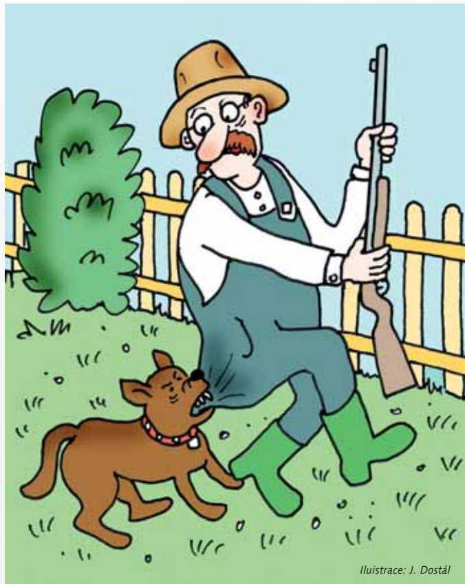
Ilustrace: J. Dostál

můžeme, pokud okolnosti nesvědčí o opaku, od rozumně vypadajícího jedince očekávat, že je rozumný. Protože rozum je velmi oše-