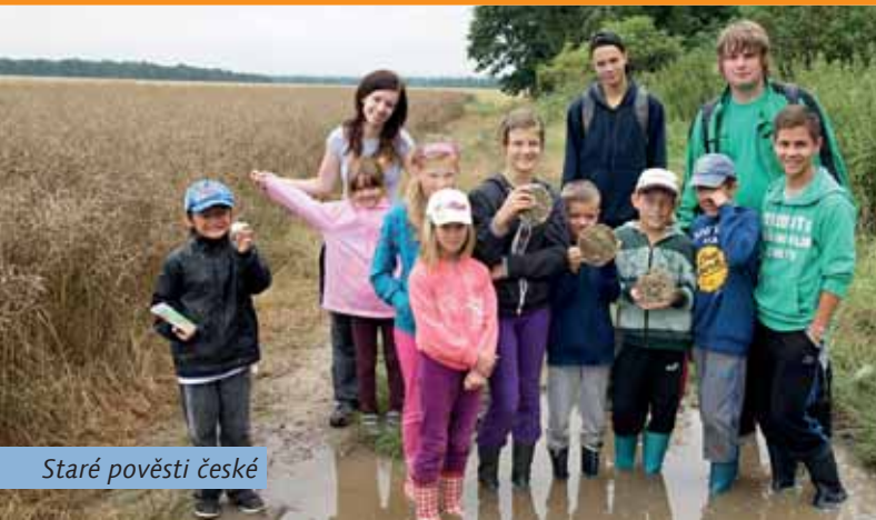
Staré pověsti české

PŘIPOMÍNÁME SOUTĚŽ ETAPOVÝCH HER Než své celotáborové hry založíte do krabice k táborové kronice a uložíte do skříně, zvažte, jestli ji neposlat i do pionýrské soutěže etapových her – když už jste si s nimi dali práci, tak proč to nezkusit! Více o soutěži najdete na ceteh.pionyr.cz .