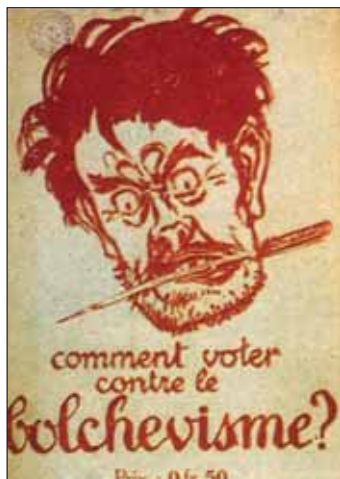
Volební plakát francouzské pravice (1919), který varuje před bolševismem.