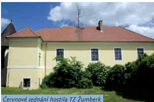
Červnové jednání hostila TZ Žumberk