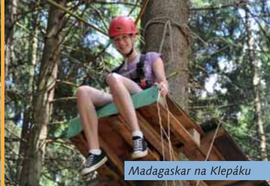
Madagaskar na Klepáku