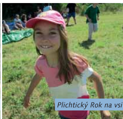
Plichtický Rok na vsi