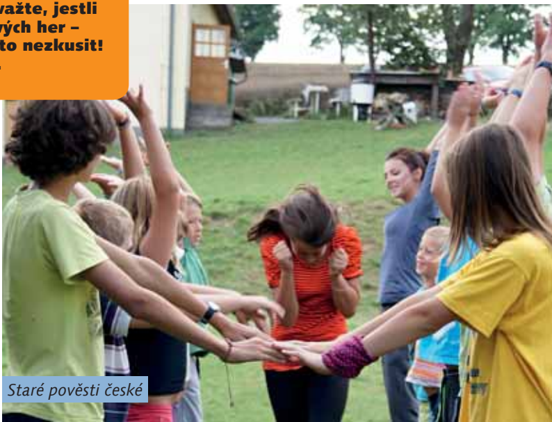
Staré pověsti české