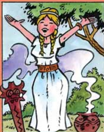
Její koníčkem bylo předpovídání. Měla dvě sestry. budoucnosti