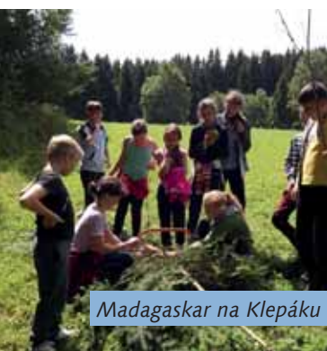
Madagaskar na Klepáku

... V pondělí, když jsme se vrátili z oběda a odpočívali jsme při hraní deskových her, zazvonil zvoneček a zaskřípaly dveře. Zvědaví, i když trochu s obavami, jsme se tam šli podívat. Ležel tam koš se vzkazem v lahvi a zabaleny dárček – pohádková knížka „Pohádky dědečka Lampáře“, díky níž jsme mohli lépe poznávat život skřítků. V lahvi byla prosba od dětí, abychom jim pomohli dostat se ze zajetí zlé noční můry Gamy. „No přece je v tom nenecháme!!!“ Všichni jsme se shodli,