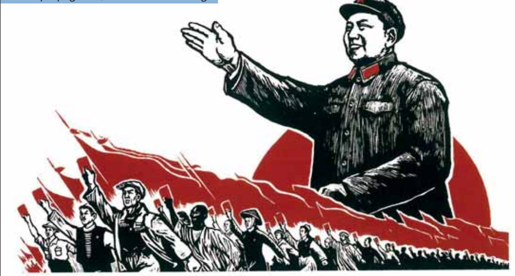
Čínská propaganda, obraz Mao Ce-tunga