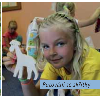
Putování se skřítky