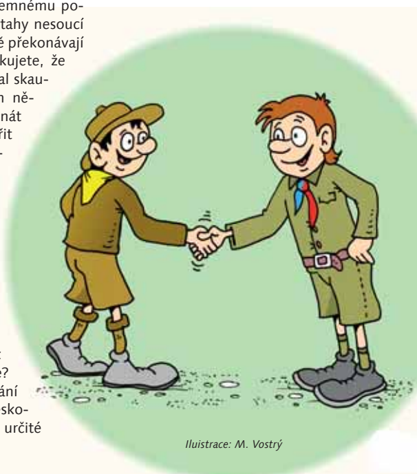
Ilustrace: M. Vostrý