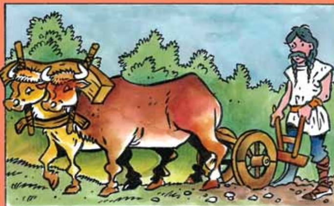
Její manžel byl zemědělec.